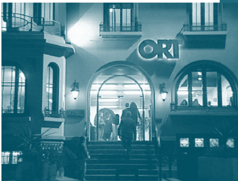
Fachada de la Facultad de Administración y Ciencias Sociales